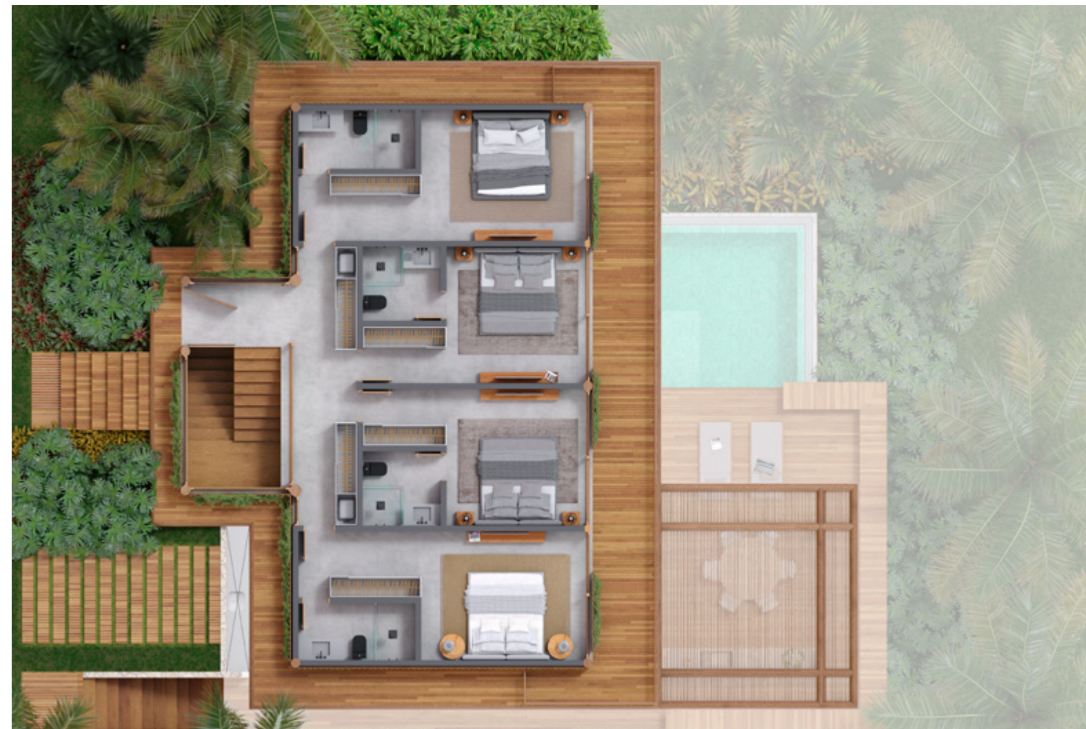
Casa tipo 3: Planta Superior