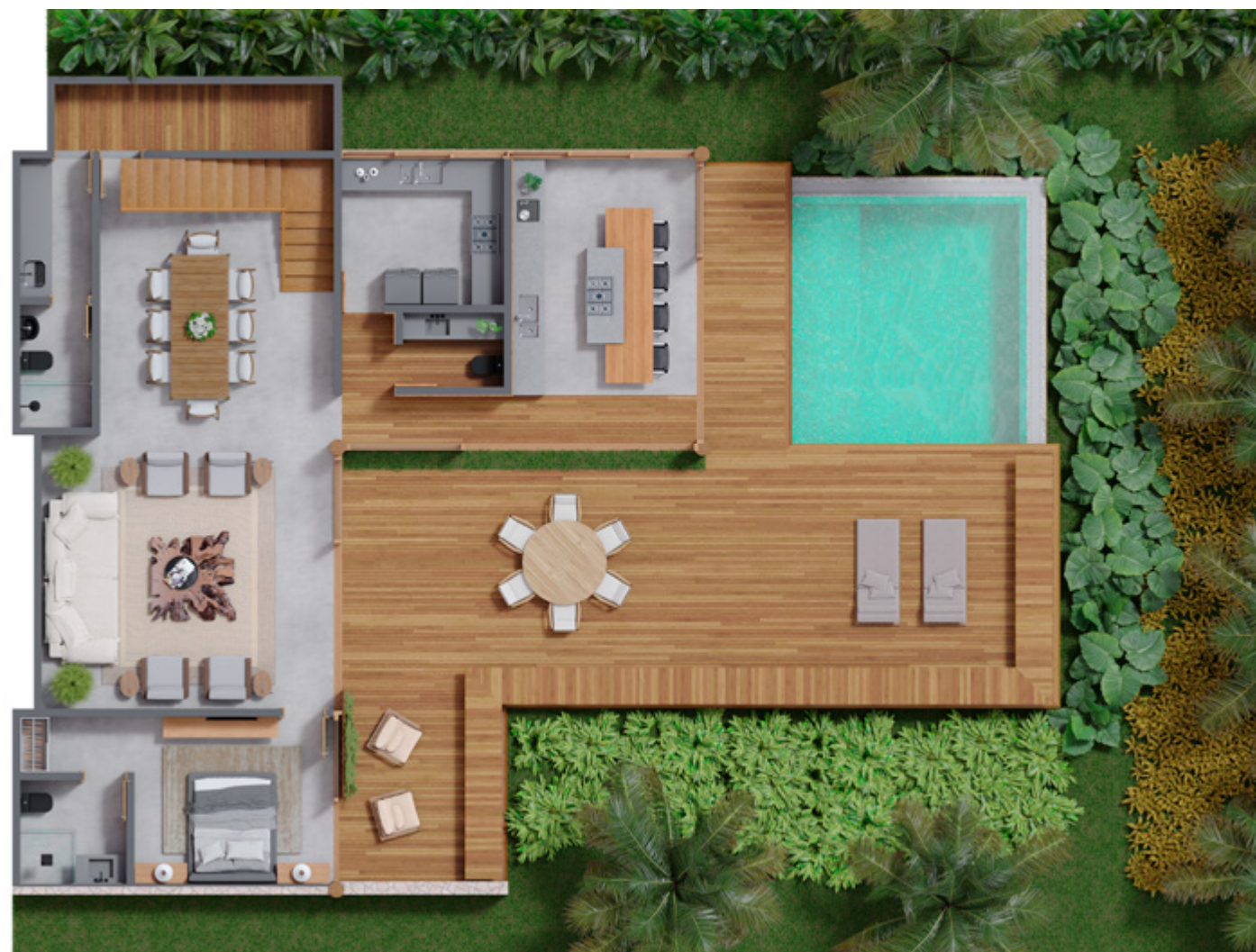
Casa tipo 1B: Planta Térreo