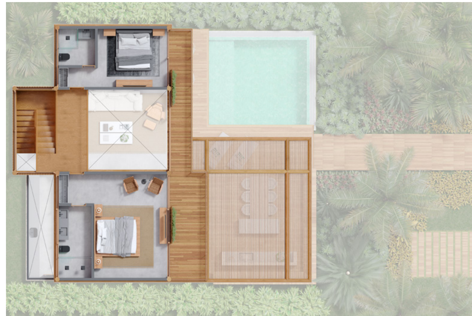
Casa tipo 2: Planta Superior