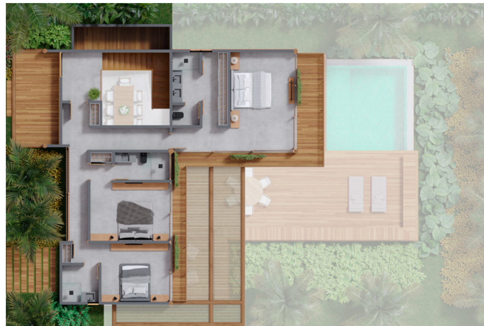
Casa tipo 1B: Planta Superior