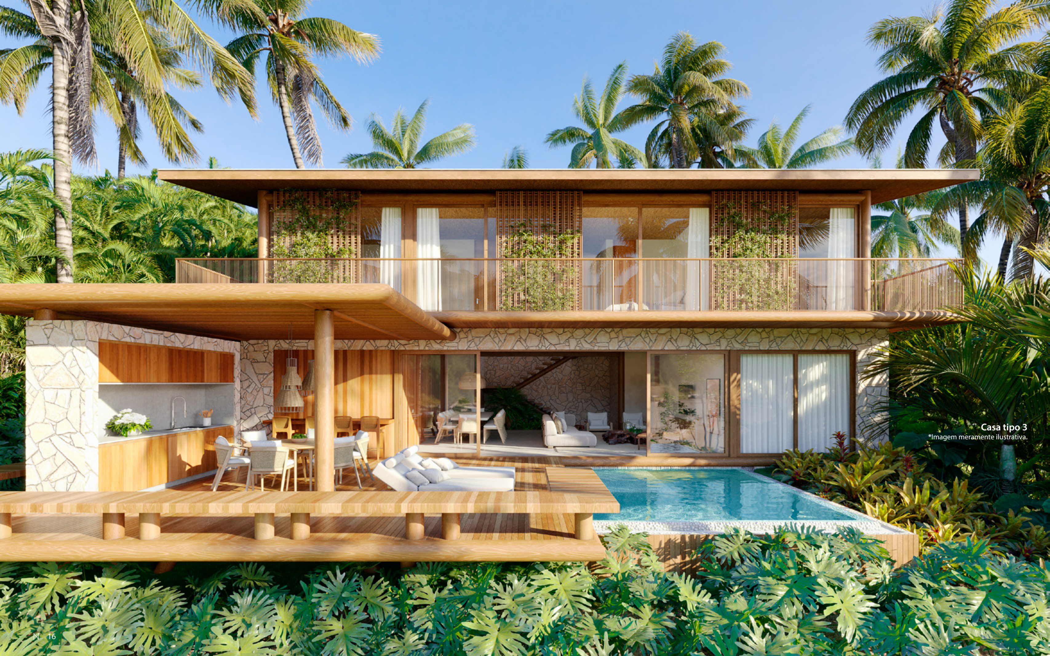
Casa tipo 3