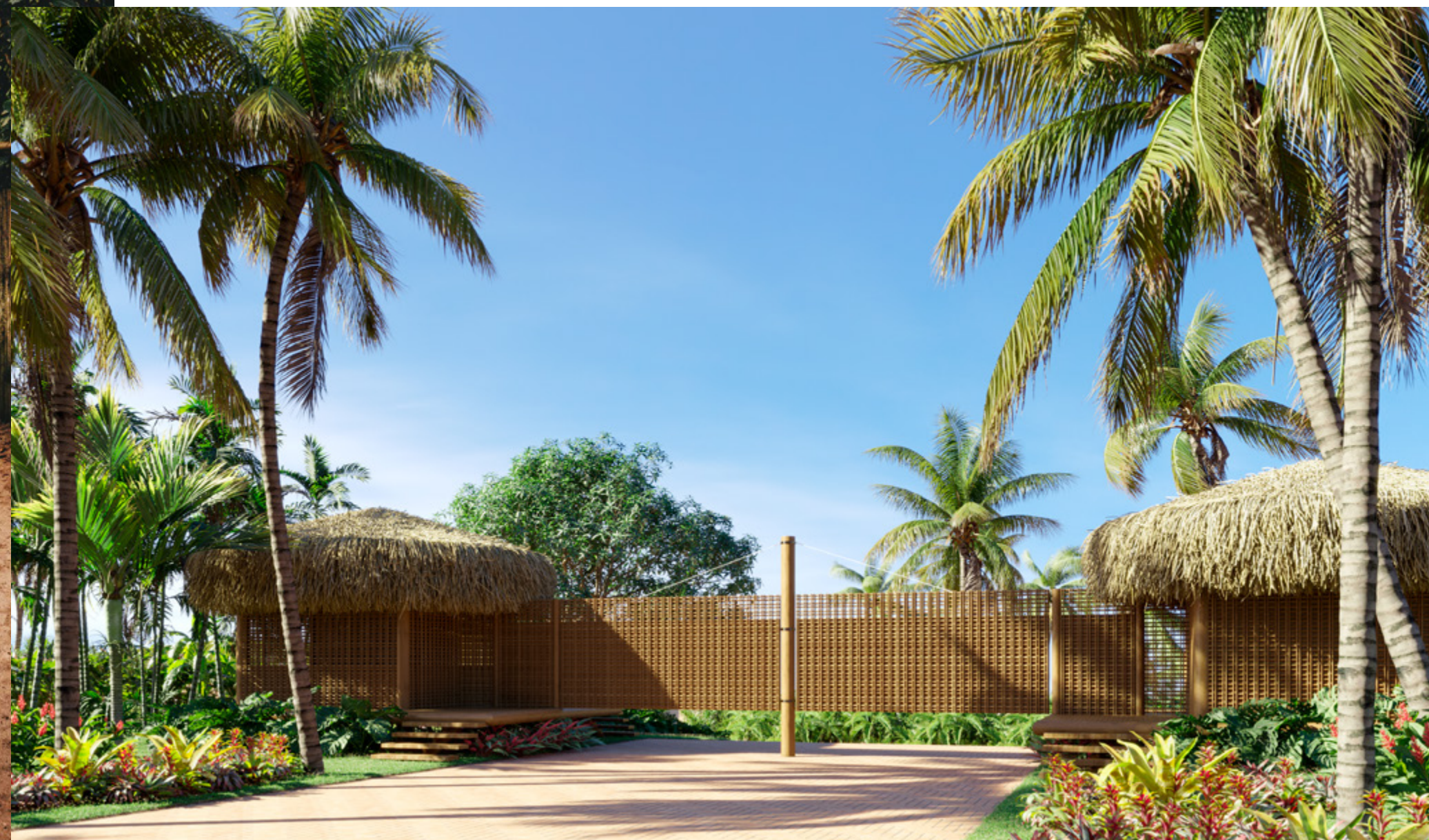
Portaria *Imagem meramente ilustrativa.

As residências emprestam os êxitos da arquitetura vernacular para moldar um ambiente confortável e fresco, com pleno conforto: piscinas privadas com deck, área gourmet e amplo living. As propriedades são arrematadas por telhados de uma só água, cujo desenho foi inspirado nas asas dos pássaros, que sobrevoam a região. As espécies da mata atlântica, acostumadas ao clima e ao solo, criam simbiose com o projeto e sua vegetação.