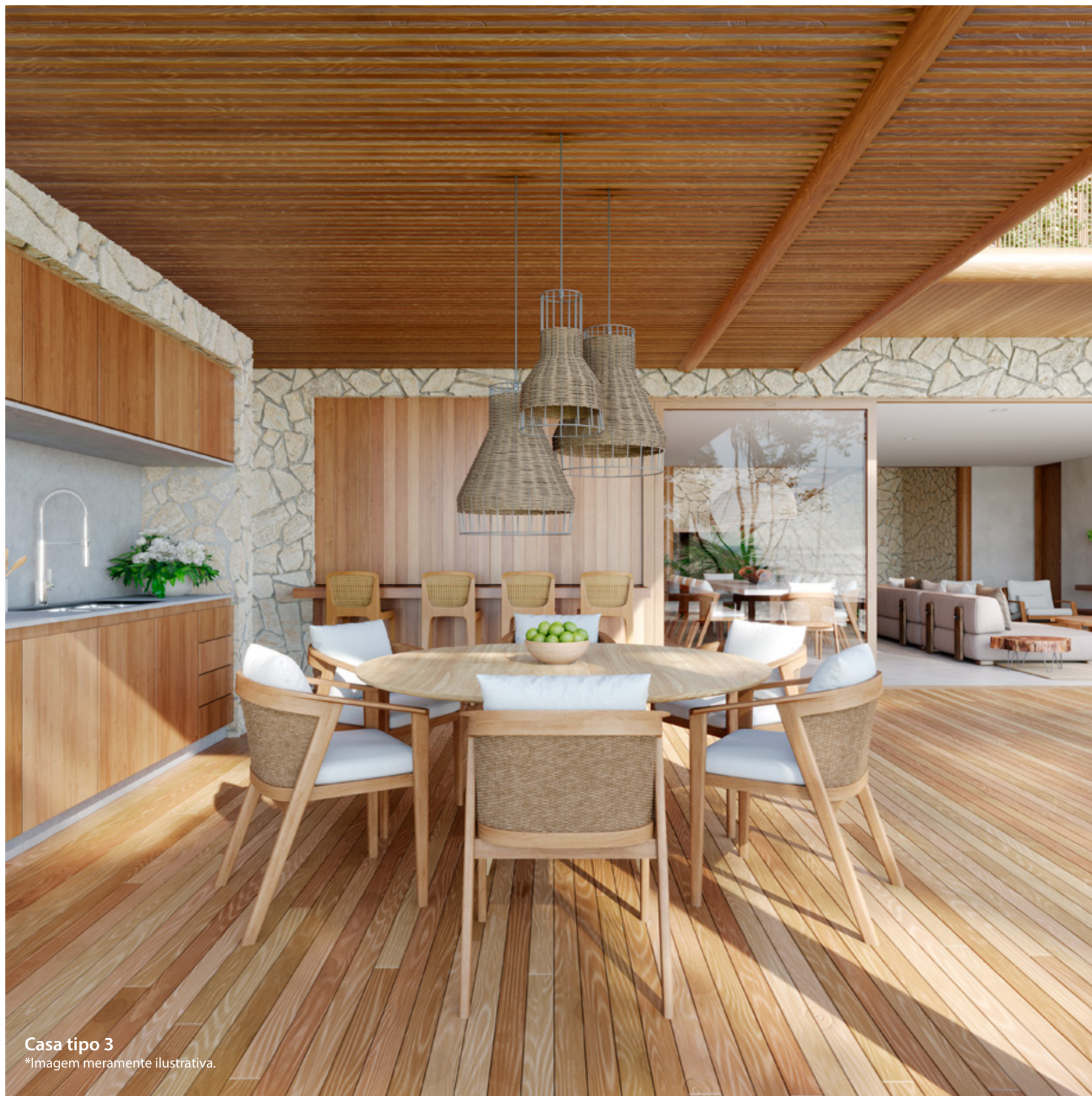
Casa tipo 3 *Imagem meramente ilustrativa.