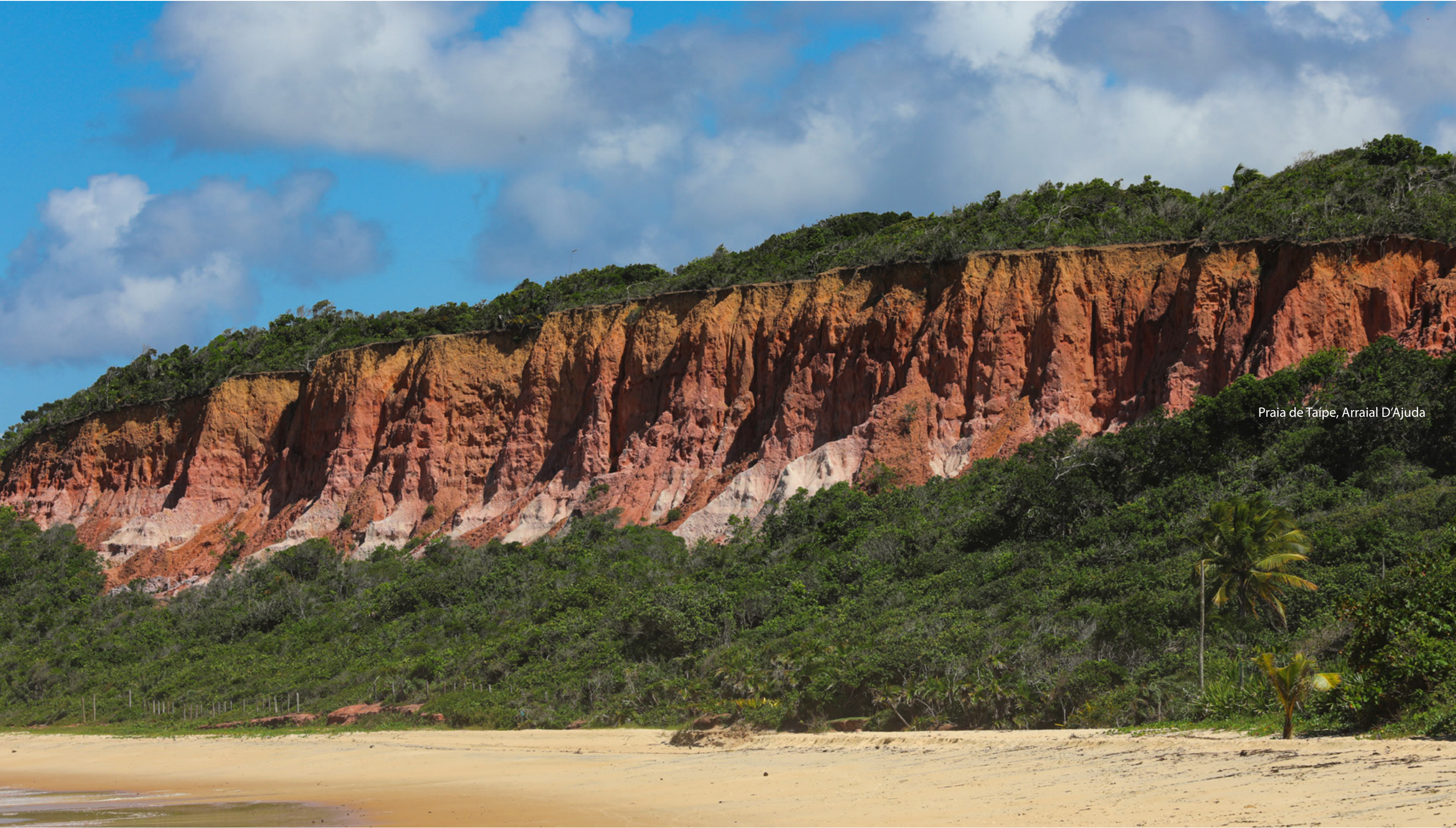
Praia de Taípe, Arraial D'Ajuda