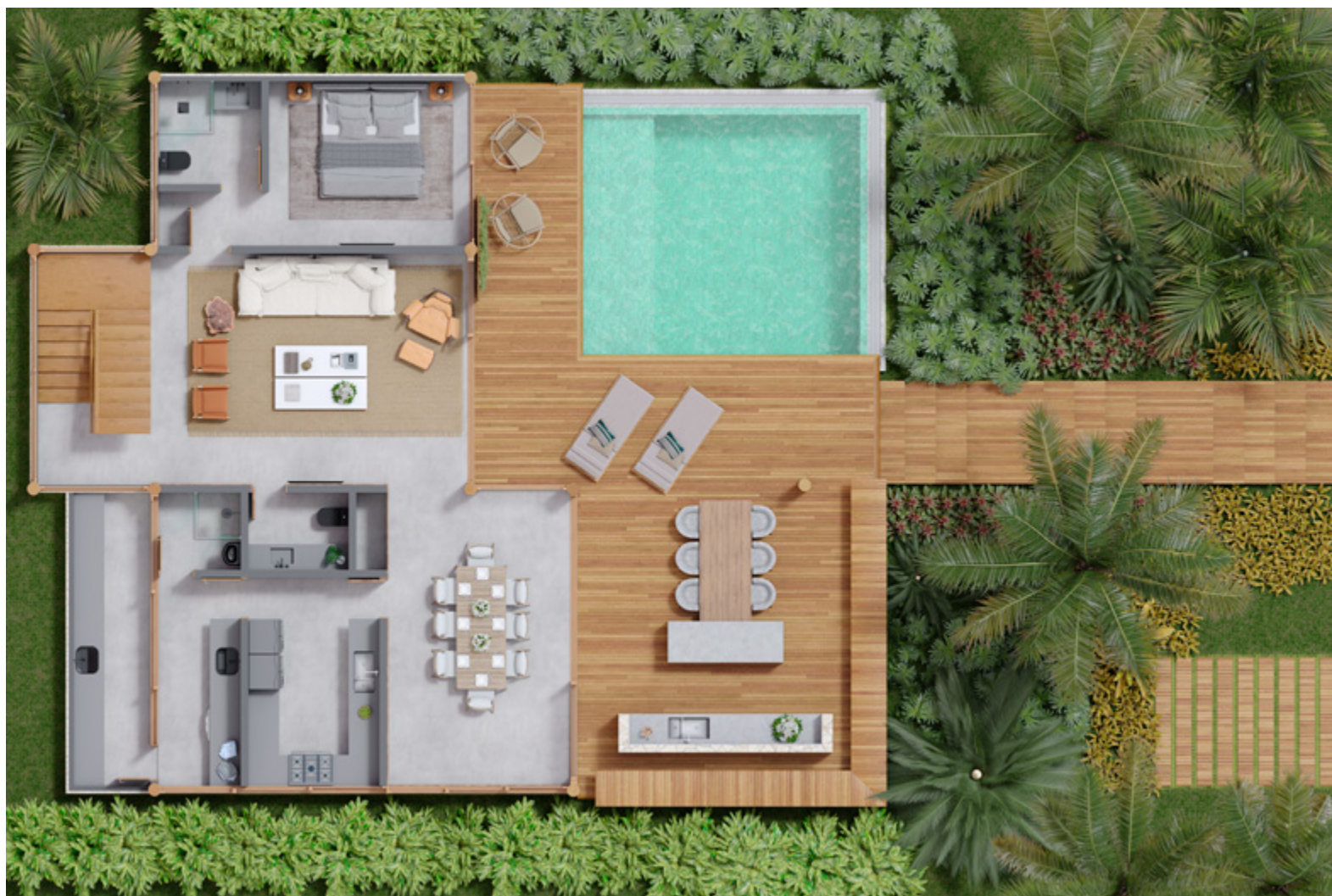
Casa tipo 2: Planta Térreo