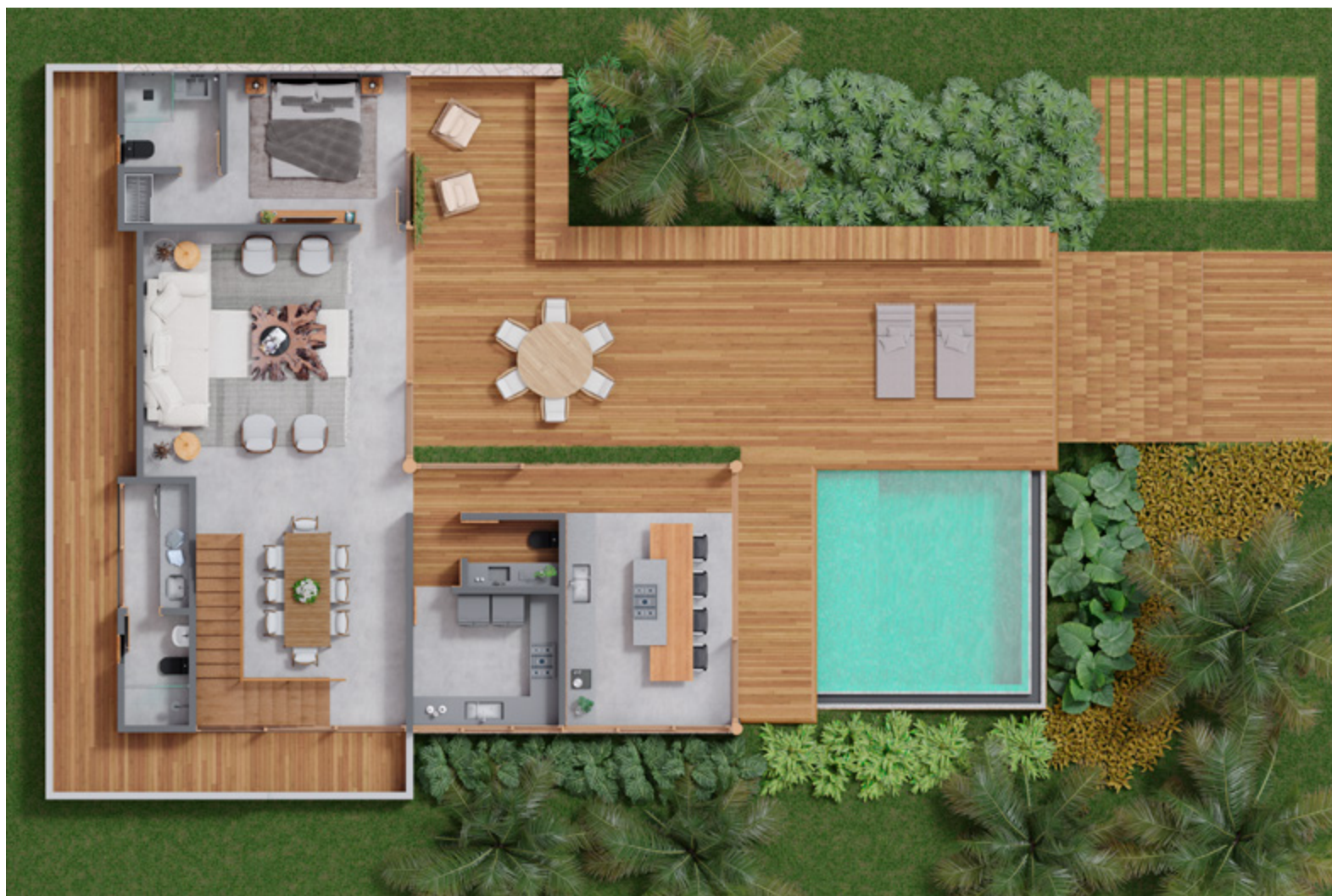
Casa tipo 1A: Planta Térreo