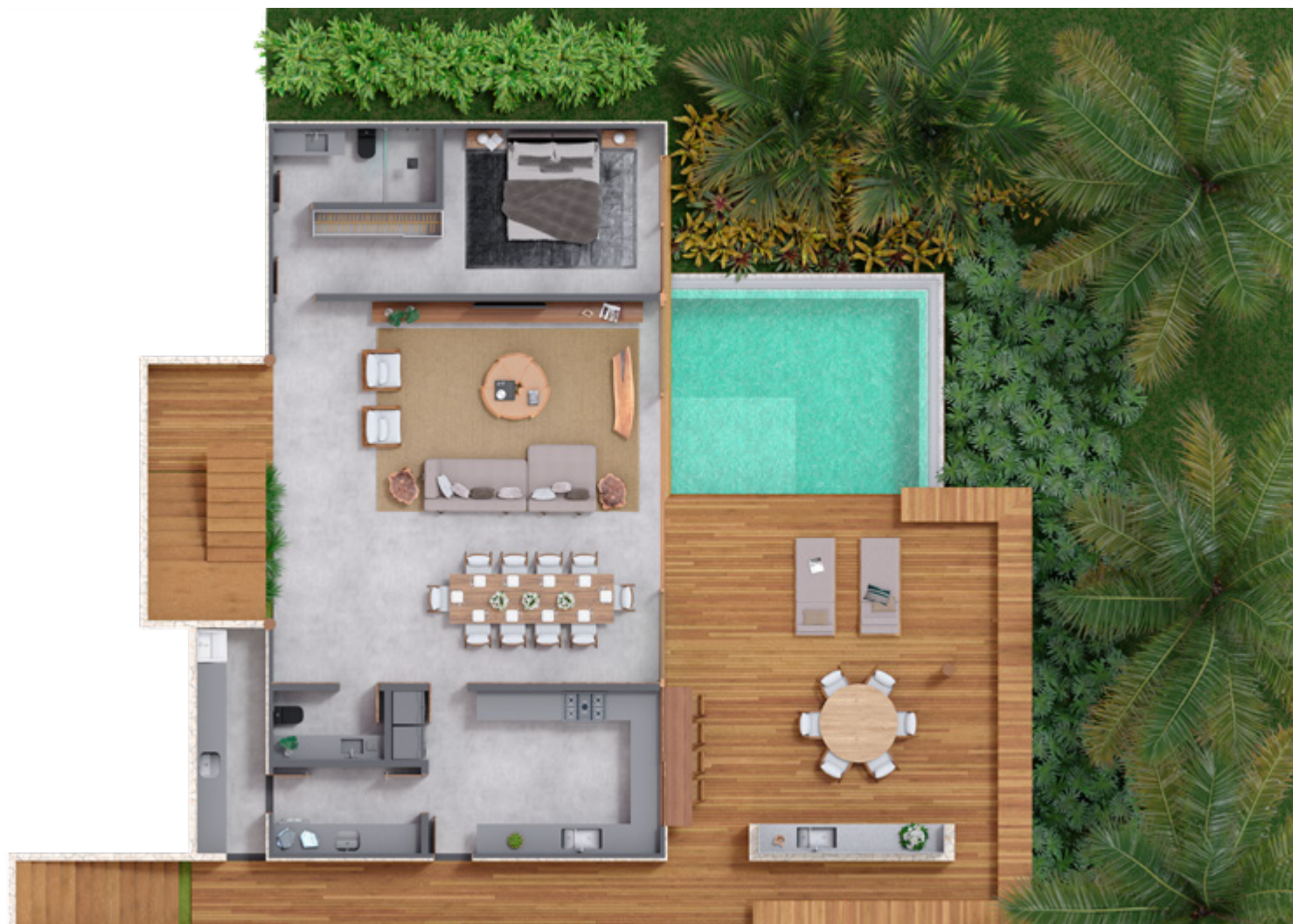
Casa tipo 3: Planta Térreo