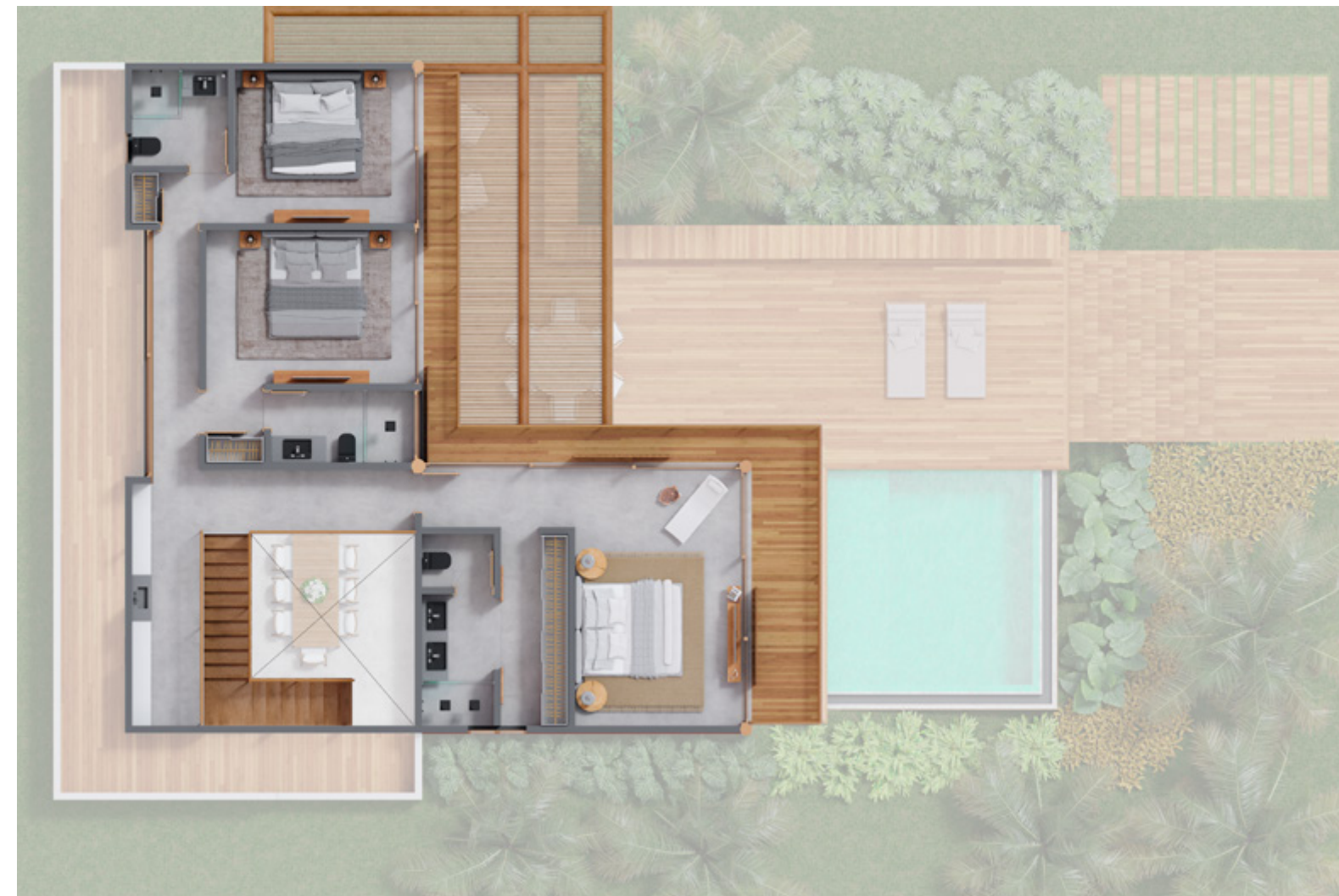
Casa tipo 1A: Planta Superior