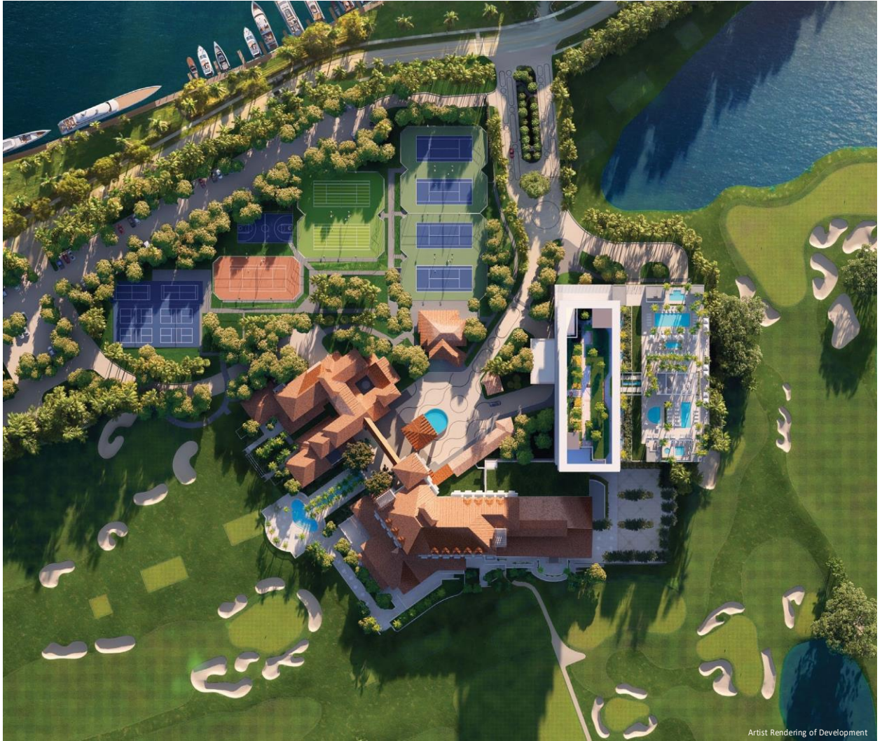
Artist Rendering of Development